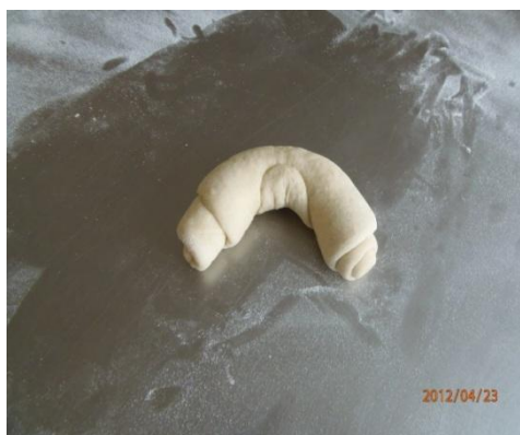
Rysunek 1. Formowanie rogali

Czas na wykonanie zadania wynosi 180 minut.