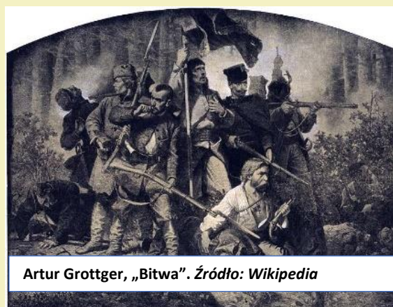
Artur Grottger, „Bitwa”.