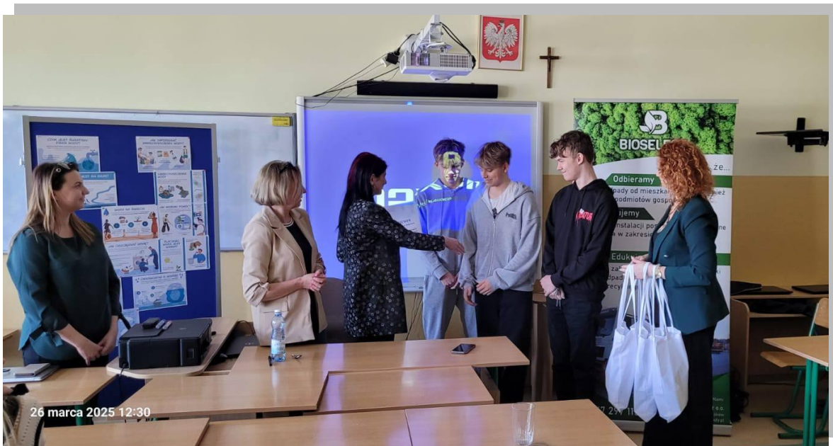
Tekst i zdjęcia: Organizatorzy